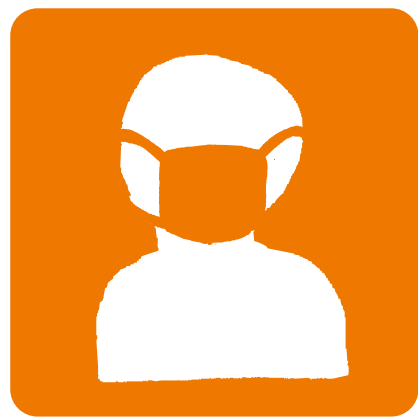
スタッフのマスク着用