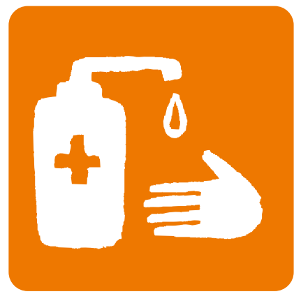
濃度70%以上 アルコール消毒液設置推奨