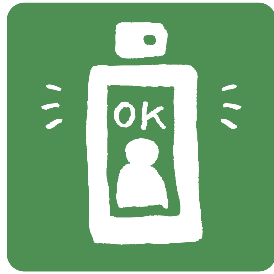
サーモカメラによる検温