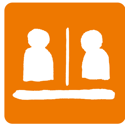
パーティション 飛散防止対策