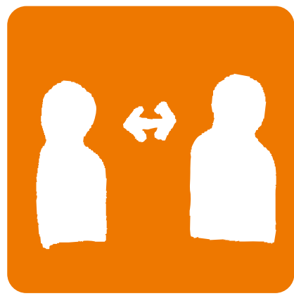
ソーシャルディスタンス 座席間隔