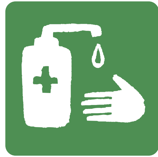
アルコール濃度70%以上の 消毒液を設置