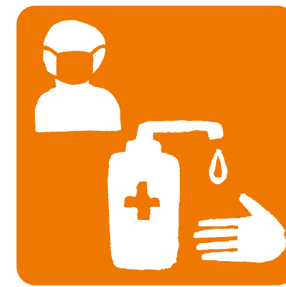
スタッフの こまめな消毒