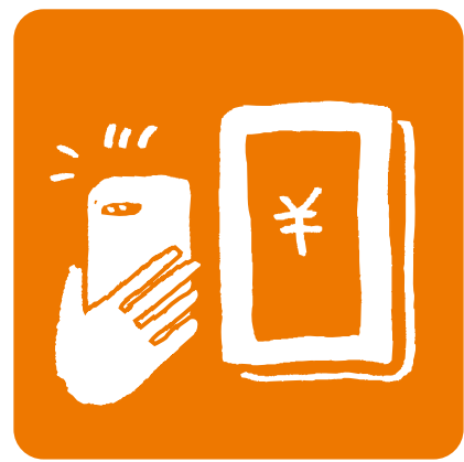
キャッシュレス決済