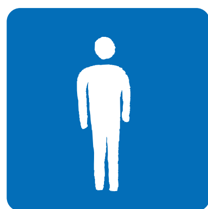
少人数での来館・ ご来店