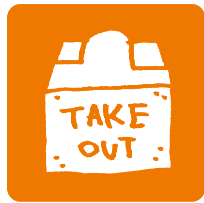
テイクアウト デリバリー