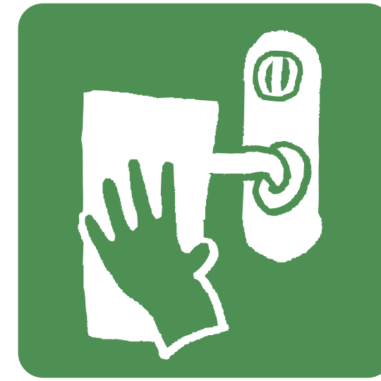
日常的な消毒清掃